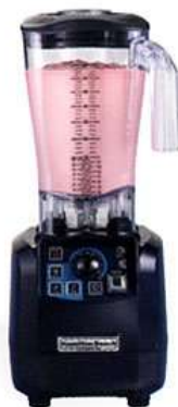
Bāra blenderis HBH650-CE