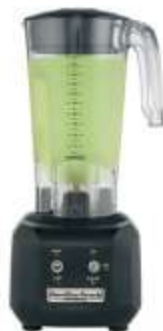
Bāra blenderis HBB250-CE