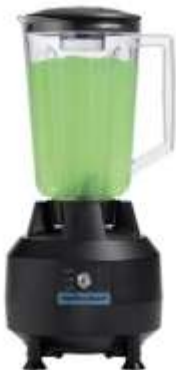
Bāra blenderis HBB908-CE