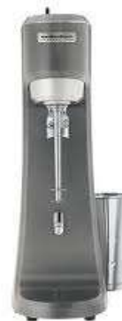
Piena kokteiļu mikseris HMD200-CE